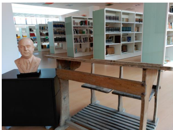
Imagen 4. Busto de D. José Vargas Gómez en la Biblioteca abaranera del mismo nombre.

que el joven seminarista pudiese acabar su último año de formación en el Seminario Conciliar de San Fulgencio (el 27 de junio de 1948 oficiará su primera misa en la Iglesia Parroquial de San Pablo, recibiendo un presente por parte de la Corporación Municipal).