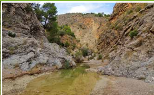
El Estrecho de la Rambla de Benito