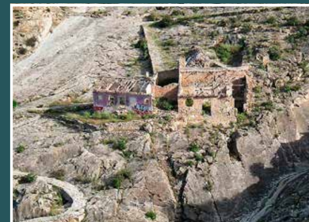
Fábrica de Esparto y Camino del Losado

Pese a estar en un entorno agreste, la Fuente de Benito constituye un paraje pintoresco con gran concentración de bienes culturales y naturales merecedor de ser visitado, admirado e interpretado a través de un itinerario patrimonial. Un viaje al pasado siguiendo el monumental Camino del Losado y el lecho de la Rambla de Benito.