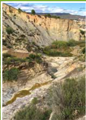
Agua de rambla discurriendo por las pozas