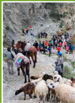
Un sitio con esencia ganadera