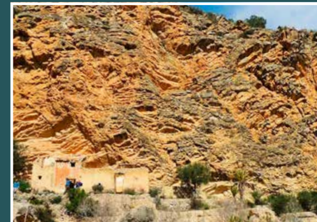
Cortado de El Estrecho y Casa del Tío Perete

Uno de los lugares de valor etnológico de Abarán es el conformado por el entorno de la Fuente de Benito, en el extremo meridional de la Sierra del Oro. Dominado por El Estrecho de la Rambla de Benito, en este angosto lugar se precipita el agua de su lecho para colmar unas escalonadas pozas excavadas en la roca caliza, ocasionando un constante murmullo acuático.